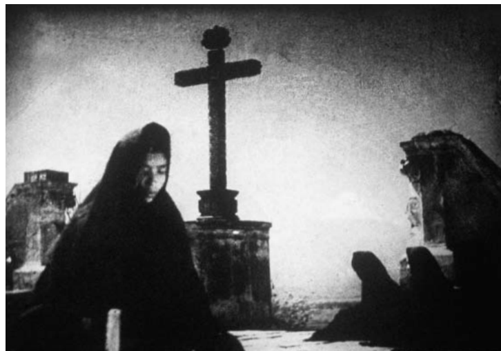
4. [...] y la versión fotográfica de Alexandrov, bajo la dirección de Eisenstein, indudablemente. Archivo Estatal de Literatura y Arte, Moscú.