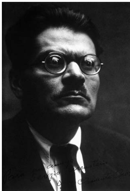
6. Retrato de José Clemente Orozco por Edward Weston, enviado por aquél a Eisenstein.