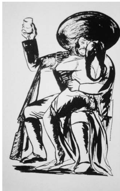
5. Otro de los grabados que impresionaron a Eisenstein. Museo de Eisenstein, Moscú.

teró seguramente a través de la radio, de la prensa o de la publicidad de dicha exposición. Lo buscó y platicaron de su proyecto de una posible película sobre México. Más que la plática con Diego Rivera, tal vez una llamada telefónica a Upton Sinclair, quien le informara que los problemas estaban resueltos, ya que gracias a la intervención del senador Borah el Departamento del Trabajo otorgó una prórroga hasta el 30 de noviembre, lo decidió a perder el barco para regresar a Los Ángeles y proseguir sus preparativos para su Mexican picture .