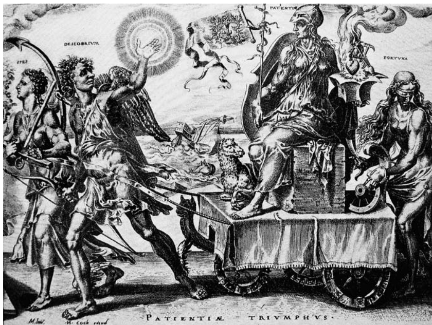
5. Maarten van Heemskerck, Triunfo de la Paciencia, grabado, impreso y publicado por Dirck Volckertszoon Coornhert.

Justificados pues los hombres de este modo, hechos ya amigos y domésticos de Dios, y caminando de virtud en virtud, se renuevan, como dice el Apóstol (Efesios, I), de día en día, esto es, que mortificando su carne, y sirviéndose de ella como de instrumento para justificarse y santificarse , mediante la observancia de los mandamientos de Dios, y de la Iglesia, crecen en la misma santidad que por la gracia de Cristo han recibido, y cooperando la fe con la buenas obras, se justifican más. 5