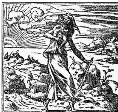
12. Emblema La Invidia , tomado de Alciato, Los emblemas de Alciato... , op. cit. ( supra n. 28) p. 220.

El patriarca José prefigura a Cristo por las acciones de su vida referidas en el Antiguo Testamento. Isidoro de Sevilla hace notar que José “en general fue traicionado, como Jesús, por su familia, y que, como él, fue acogido por una nación extranjera”. 30 Por eso es importante el blasón con el panal de abejas, pues muestra la relación iconográfica entre los dos personajes. Podría advertirse en ese motivo que la vida de José y su triunfo es una figura de la vida de Cristo y su victoria sobre la traición. La historia de José y de la mujer de Putifar remite de modo directo a la Pasión de Cristo. “La mujer de Putifar es la Sinagoga acostumbrada a cometer adulterio con los dioses extranjeros; trata de seducir a Jesús, que rechaza su doctrina y que finalmente deja entre sus manos su manto, es decir su cuerpo, del que se despojó en la cruz.” 31 De ahí que el Triunfo ... exprese su victoria sobre la traición, que lo llevó a la muerte humana, pero de la cual salió vencedor.