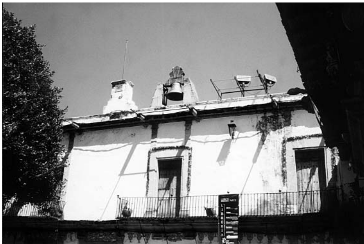
1. Casa Borda, Taxco, Guerrero, México.