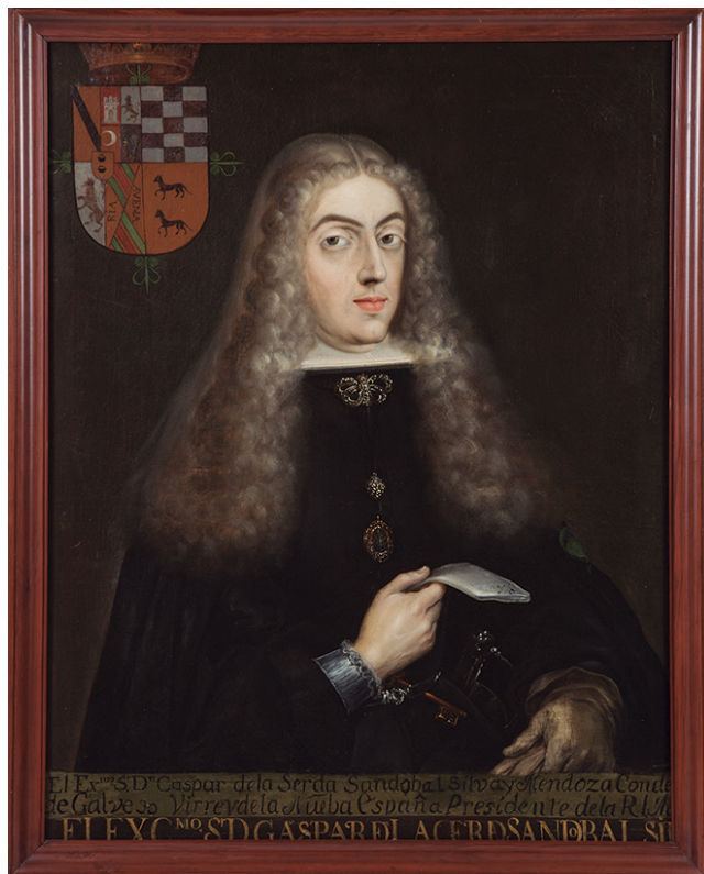
2. Anónimo, El Excmo. Sr. D. Gaspar de la Cerda Sandoval Silva y Mendoza, conde de Galve, 30 virrey de la Nueva España y presidente de la Rl. Ada, 1690, óleo sobre tela. Museo Nacional de Historia del Castillo de Chapultepec, Ciudad de México.

que el capítulo más brillante de su gobierno es el bélico —por las luchas con indios o franceses, sucedidas desde su llegada—, las victorias españolas servirán para propiciar la alabanza al virrey. En tal sentido, sor Juana Inés (1651-1695) escribe Epinicio gratulatorio al conde de Galve , y Sigüenza (1645-1700), para celebrar “el triunfo de la Armada de Barlovento” —victoria naval contra los franceses en Santo Domingo, decisiva para la Corona—, elabora “un volu-