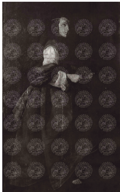
5. Francisco de Zurbarán (1598-1664), Santa Casilda, óleo sobre lienzo, medidas desconocidas. Palacio Arzobispal de Granada.

nio Moro; una santa Casilda de Zurbarán (fig. 5); 39 Apolo con el arpa acompañado de Pan; y la escultura de san Juanito, de Alonso Cano, que actualmente se encuentra en la catedral de Granada. En dos de estas fotografías se aprecia un gran tapiz con decoración de santos, delante del cual se sitúa una cruz de orfebrería y dos candelabros, en el reverso está escrito que la cruz es de bronce.