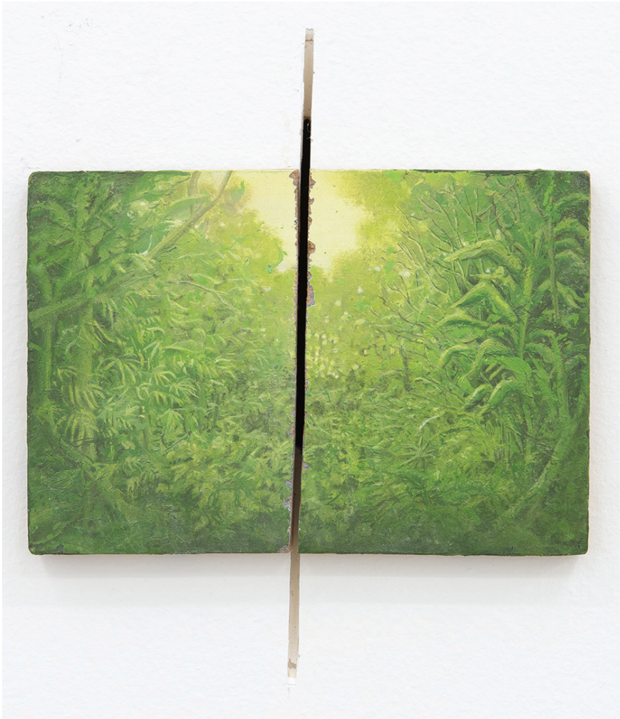
1. Francis Alÿs, fragmento de The Cut , 1993-2015, acción, óleo sobre tela y video. Cortesía de Francis Alÿs.

es si la exposición de Alÿs puede considerarse un epítome del papel de la pintura en el arte contemporáneo y cómo funcionaría.