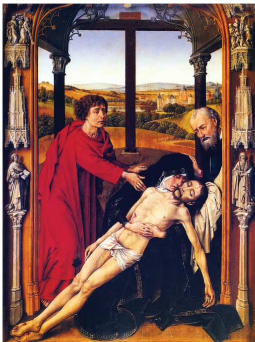
12. Copia de Rogier van der Weyden, la Piedad , 1435-1438, 71 × 43 cm. Capilla Real de Granada.

la tabla. 33 La imagen icónica de la Imago Pietatis bizantina, dentro del sistema naturalista del Renacimiento, se retoma en un sentido decididamente arcaizante para subrayar la ruptura entre la naturalidad humana y la trascendencia divina. El estado natural, caído y pecador del hombre, algo que las artes liberales del ideal clásico lograron plasmar con nitidez, imposibilitan cualquier identificación total con Dios. 34