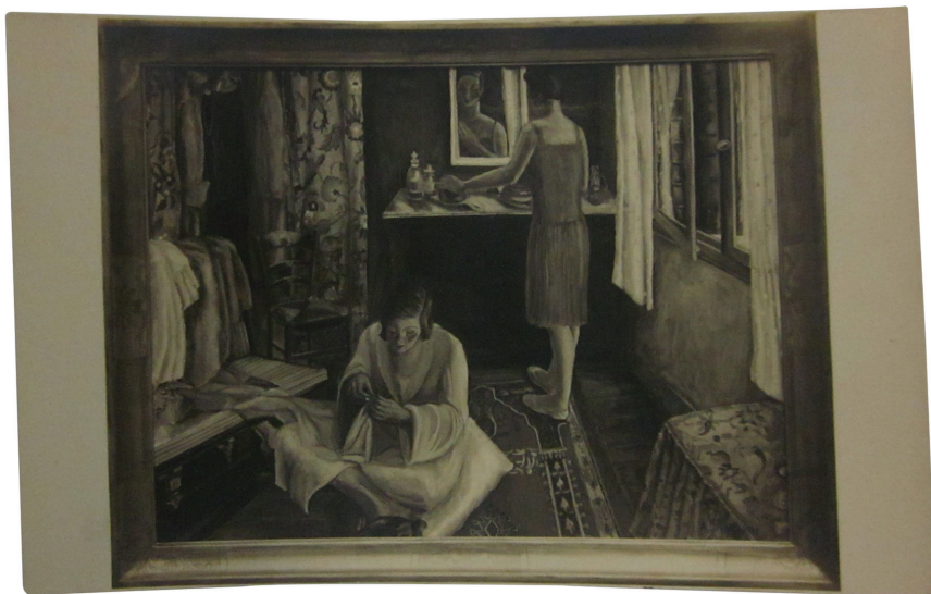
2. Fotografia da obra La rentrée pertencente ao Fundo Anita Malfatti (FAM) do Arquivo do Instituto de Estudos Brasileiros da Universidade de São Paulo - IEB/USP.

As imagens de Anita Malfatti e Tarsila do Amaral que emergem dos arquivos das pesquisadoras são muitas e complexas. De um lado, trazem a dimensão da esfera privada, retratando a vida familiar e social; de outro, a carreira profissional que pode ser apreendida pelas fotografias de obras e recortes de jornais sobre elas.