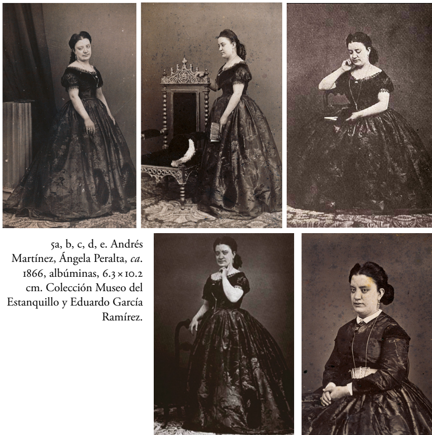
5a, b, c, d, e. Andrés Martínez, Ángela Peralta, ca. 1866, albúminas, 6.3 x 10.2 cm.