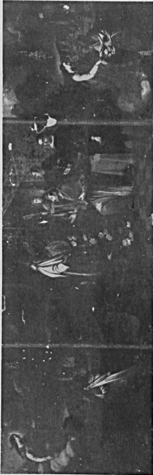
3, Senén Vila. Triptico de Ntra. Sra. de Guadalupe . Óleo. 1690-95.