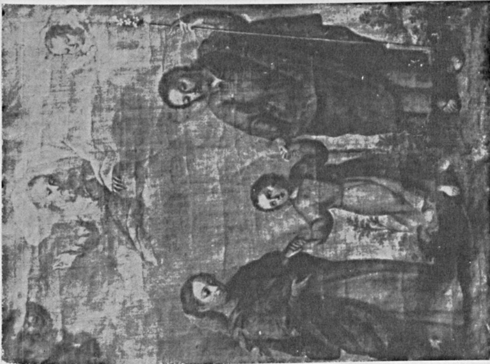
1. Nicolás Martínez. Sagrada Familia . Óleo. 1781.