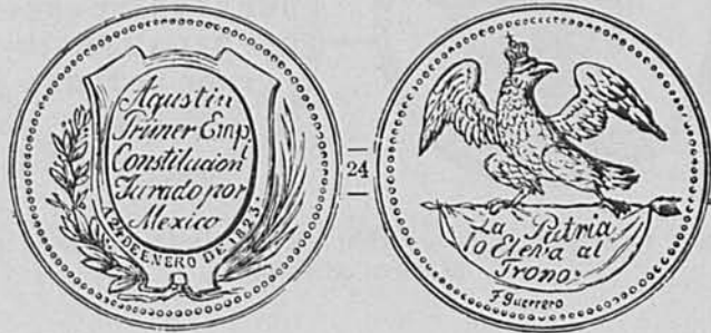
José Guerrero. Proclamación de Agustín de Iturbide. Medalla.