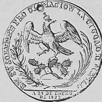
José Guerrero. Proclamación de Agustín de Iturbide. Medalla.