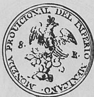
José Guerrero. Moneda.