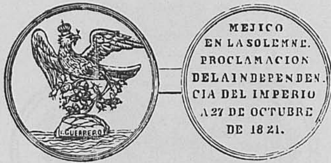
José Guerrero. Proclamación de la Independencia de México. Medalla.