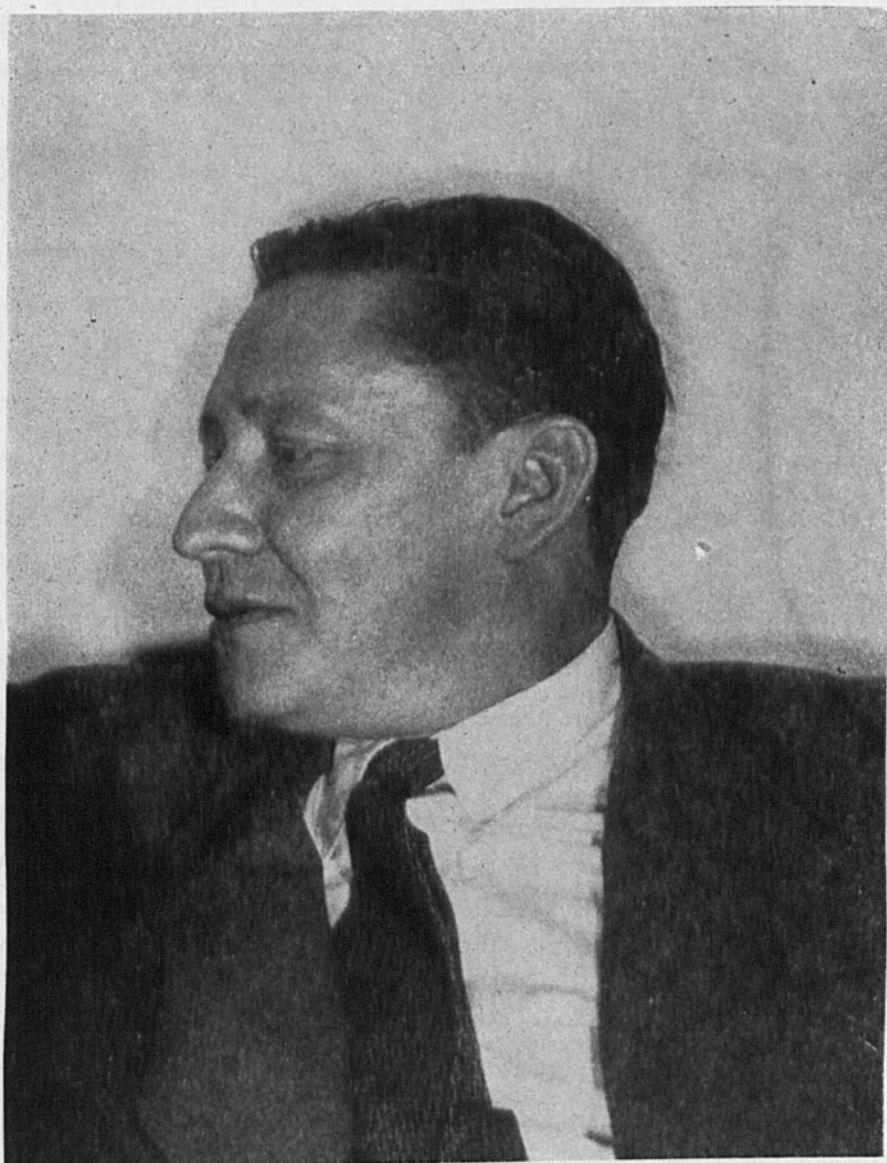
1. Gilberto Owen. ca. 1950.