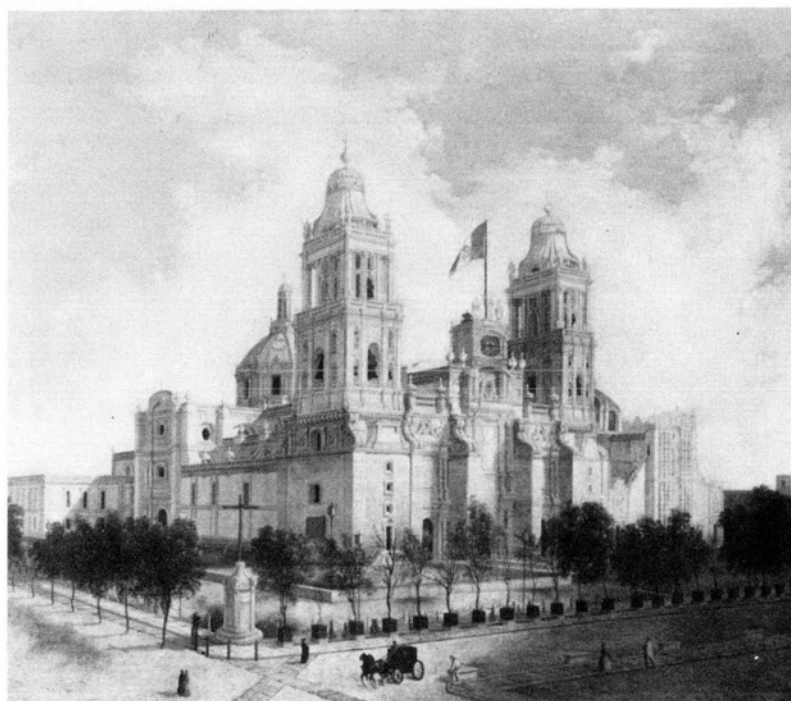
9. Manuel Serrano. La Catedral de México.