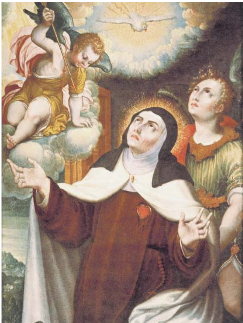
Figura 3. Alonso López de Herrera, Transverberación de santa Teresa de Jesús , ca. 1640, óleo/cobre, colección particular.

Aunque la producción de pintura en cobre en España parece haber sido muy menor a la flamenca y a la italiana, la categoría de imágenes religiosas con iconografía fija, como es el caso de vírgenes de diferentes advocaciones,