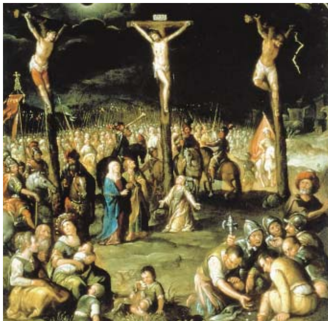
Figura 1. Baltasar de Echave Ibía, la Crucifixión , 1638, óleo/cobre, colección particular.

su producción conocida, existen dos láminas relativamente grandes de la Crucifixión (figura 1) y del Camino al Calvario , fechadas en 1638 y 1639, respectivamente. 8 Es curioso que el orden de los años no corresponde a la cronología de los hechos representados, ya que Echave pintó primero la Crucifixión . Tampoco son iguales las técnicas de aplicación del color en las dos obras. 9 Estas circunstancias sugieren que las láminas, a pesar de constituir una pareja, fueron producto de un proceso de experimentación; tal vez también por eso su autor las fechó (no siempre lo hacía). Probablemente Echave Ibía se inspiró en obras flamencas, igual que el autor de las dos láminas con los mismos temas que están en el Museo de la Casa de los Muñecos de