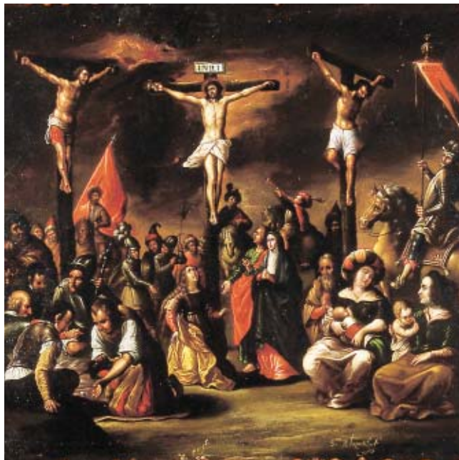
Figura 2. Gerónimo de la Portilla, la Crucifixión , siglo XVII óleo/cobre, Museo de la Benemérita Universidad Autónoma de Puebla, Casa de los Muñecos.

Puebla (figura 2). El parecido entre sus composiciones y éstas es notable. 10