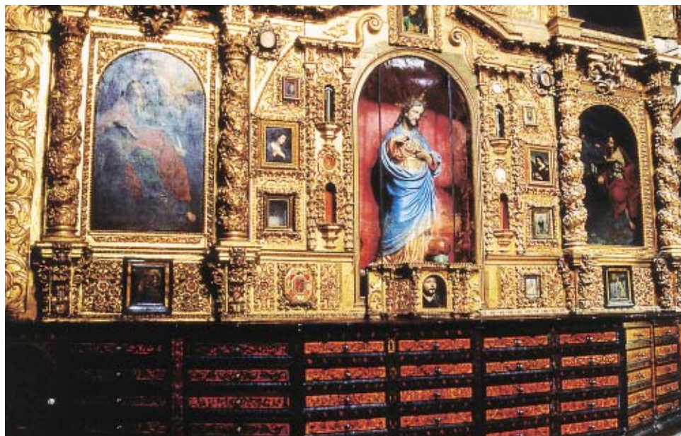
Figura 10. Detalle del retablo, sacristía de la iglesia de la Compañía, Puebla.

Todos estos ejemplos, sin embargo, podían también ser objeto de miradas más distantes y menos comprometidas. Algunas de las láminas que se conservan en sus lugares originales en la América española atestiguan que en muchas ocasiones se propiciaba un tipo de recepción que ponía menos atención en los detalles y más al efecto de conjunto. En la capilla del Ocho de la catedral de Puebla, que puede considerarse la más antigua colección de pintura todavía en su lugar original en la Nueva España, por ejemplo, las paredes y los retablos de talla exquisita exhiben láminas de cobre junto con reliquias y obras de plumaria y bordado. Las obras que están en la parte inferior de los retablos pueden observarse bien, pero no las demás, y es posible que el público en general rara vez haya tenido más que una visión de lejos del conjunto. Desde una obligada vista a distancia, el efecto es de una serie de objetos preciosos sobre fondos dorados; los temas específicos y la lectura atenta parecen importar relativamente poco. Ha habido una transformación de la mirada con el cambio de localización y propiedad: de la apreciación cercana y particularizada del dueño original al asombro desde lejos de un público más amplio y menos experto.