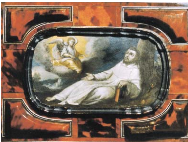
Figura 5. Gregorio Vásquez, San Benito , ca. 1670, óleo/cobre, colección particular.