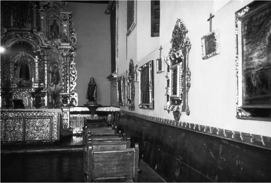
Figura 9. Capilla del Carmen, Convento de los Descalzos, Lima, Perú.

López de Herrera: una Santa Teresa (figura 3). En este retrato de la santa, que tiene el mismo formato de tres cuartos que los demás cuadros de santos en cobre del pintor, la lámina fue recortada en forma de corazón en el pecho de la monja carmelita, tal vez para dar lugar a una verdadera reliquia.