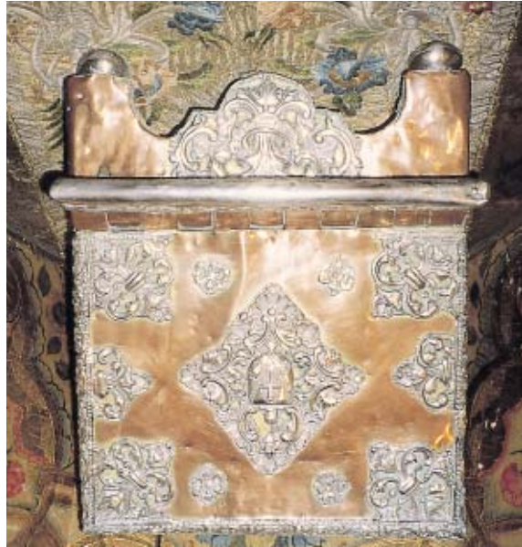
Figura 7. Atril en cobre y plata, siglo XVII, Museo Arquidiocesano de Arte Religioso, Popayán, Colombia.

plata. Así, el cobre llegó a ser un material relativamente escaso y, por lo tanto, más precioso. Inventarios novohispanos muestran que, por lo general, las láminas no eran muy caras; su valor monetario parece haberse asignado más en consideración de los marcos que del soporte de las pinturas. 31 En Sudamérica aun las cazuelas de cobre tienen un valor importante en los inventarios. 32 Tan precioso era el metal rojizo que se utilizó, por ejemplo, adornado en plata, para un atril de altar (figura 7). Respecto a España, fue sólo a fines del siglo XVIII cuando el metal tuvo mayor presencia, tanto por extracción local, como por importación desde Nueva España.