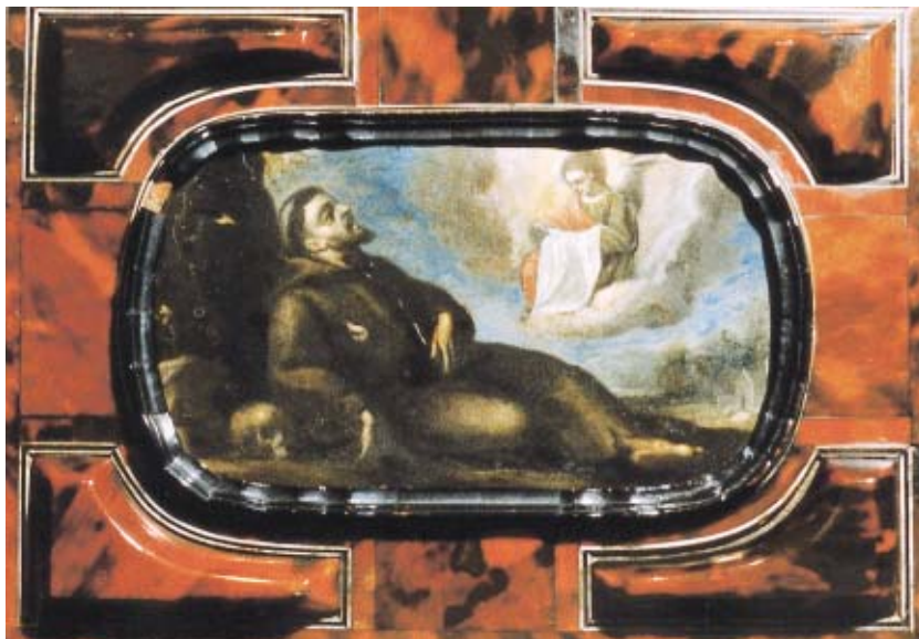
Figura 4. Gregorio Vásquez, San Francisco , ca. 1670, óleo/cobre, colección particular.