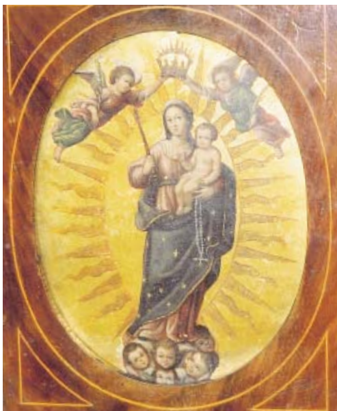
Figura 6. Anónimo, Virgen del Rosario , siglo XVII, óleo/latón, Museo de Arte Colonial, Bogotá.

ejemplo, produjo una cantidad importante de obras sobre cobre. Con Antonio Sánchez, hizo una serie de láminas de la Pasión entre 1768 y 1769 (Museo Regional, Guadalajara), y muchas otras obras devocionales ostentan su firma. Su interés en los soportes de metal lo llevó a trabajar también sobre gruesas láminas de latón (hasta de tres milímetros de espesor), de las que se conocen actualmente por lo menos trece. Para completar el panorama del siglo XVIII, hay que añadir que solamente al final de la centuria despuntó un poco la producción de pinturas sobre cobre tanto en Sudamérica como en España, mientras en la Nueva España no parece haber disminuido durante todo el siglo.