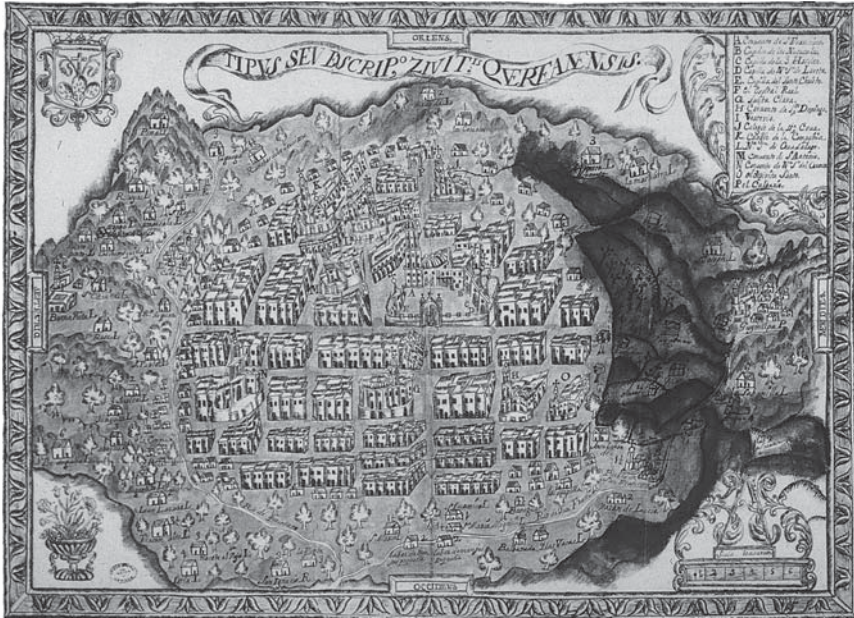
1. Plano de Querétaro, 1714 —el original se localiza en el Archivo General de Indias, Sevilla—, tomado de Carlos Arvizu García, Querétaro: aspectos de su historia , Querétaro, Instituto Tecnológico de Monterrey-Universidad Querétaro, 1984, p. 51.

fueron sus abuelos paternos; sus bisabuelos, en esta misma línea, el capitán Francisco de Medina Murillo e Isabel González Corona. Por lo que se refiere a sus abuelos maternos, él mismo declaró que eran Sebastián de Ocio e Isabel de Ocampo y que Luis de Ocio y Faviana de Monroy y Ocampo eran sus bisabuelos maternos. 9