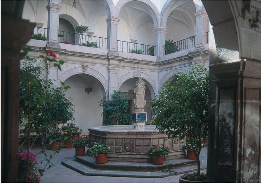
6. Convento de San Antonio de Padua, Querétaro.

habiendo casi veintiocho años que estaba amenazando ruina, sin haber quien metiese la mano a la obra, a su reparo vino (Juan Caballero y Ocio) a poner manos a la obra, alargando la mano de su liberalidad para que por ella quedase (como ha quedado) reparado el templo. 79