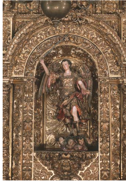
8. San Miguel, detalle de uno de los retablos de la capilla de Los Ángeles en la Catedral de México.

Consejo “lo mucho que se debe atender al pretendiente por lo singular de sus obras”. 100 A su vez, el Consejo señaló: