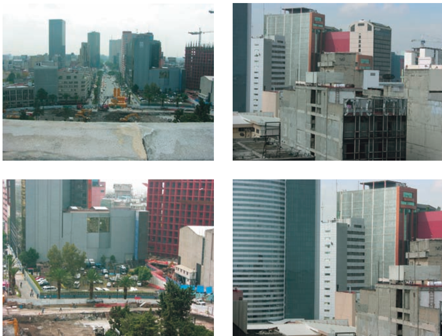
3. Vistas panorámicas. Foto: Peter Krieger, 2010.

qué casi no hay bulevares con altura y contornos homogéneos —como en las secciones históricas de París—, sino la acumulación heterogénea de edificios, terrenos abandonados, que generan una cacofonía visual inaceptable? El grado de deterioro de la imagen urbana se observa en el contexto inmediato del monumento, donde se abren rupturas y brotan atrocidades arquitectónicas. Esta vista provoca un debate sobre los valores del desarrollo urbano, en particular, sobre si debería haber una clara definición de la “propiedad obliga” (como lo establece, por ejemplo, la Ley Orgánica en Alemania); es decir, una obligación de no abandonar un terreno visible para convertirlo en estacionamiento, o un convenio en el que se establezca que ninguna construcción alrededor de este monumento pueda rebasar la altura del mismo, o garantizar la transparencia pública en las plantas bajas (como es costumbre en muchas zonas vitales de Manhattan), entre otros parámetros más del diseño urbano. Es una ganancia contar con una plaza revitalizada, con árboles y bancas, pero también conviene “educar” a los inversionistas y explicarles su responsabilidad con respecto a