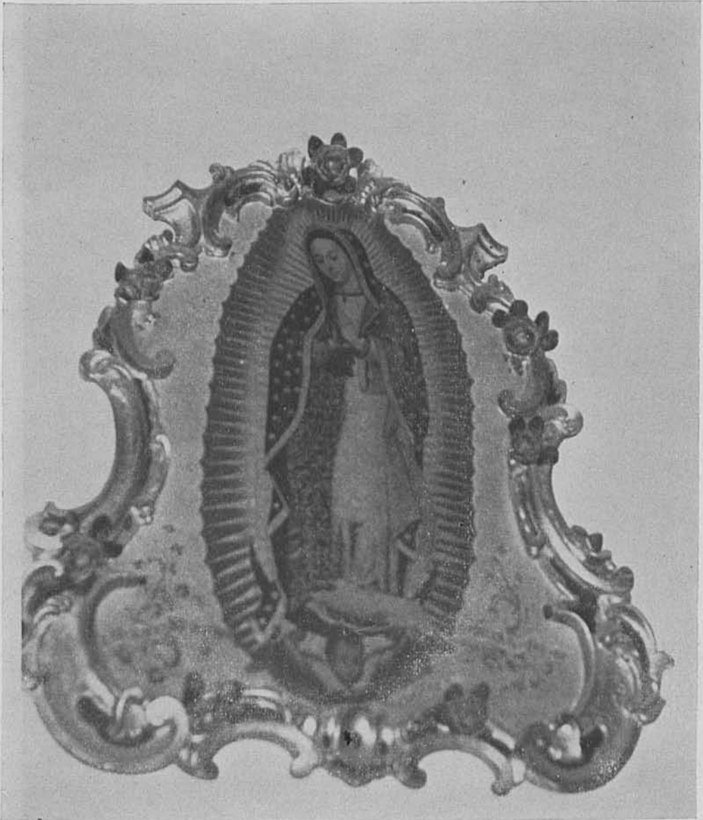
1. Virgen de Guadalupe . San Felipe Neri. Palma de Mallorca.