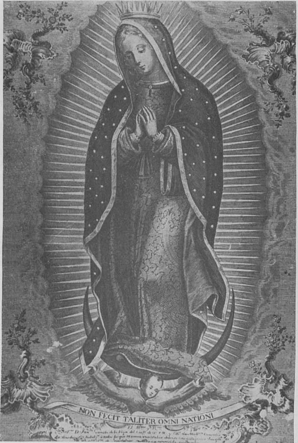
2. F. Nuntaner. Virgen de Guadalupe . 1765. Palma de Mallorca.