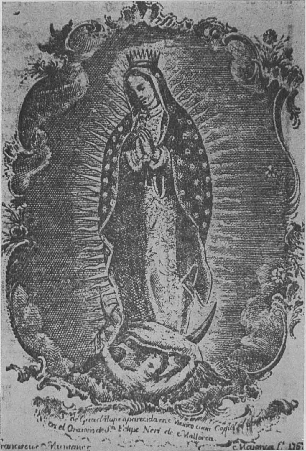
3. F. Nuntaner. Virgen de Guadalupe . Grabado, 1767 Palma de Mallorca.