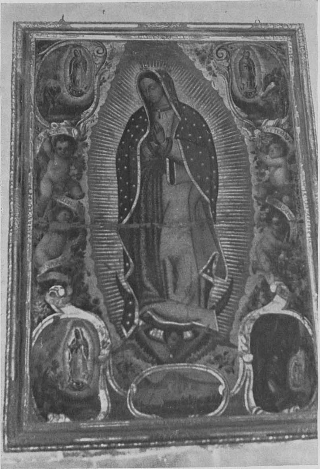
5. Virgen de Guadalupe . San Felipe Neri. Palma de Mallorca.