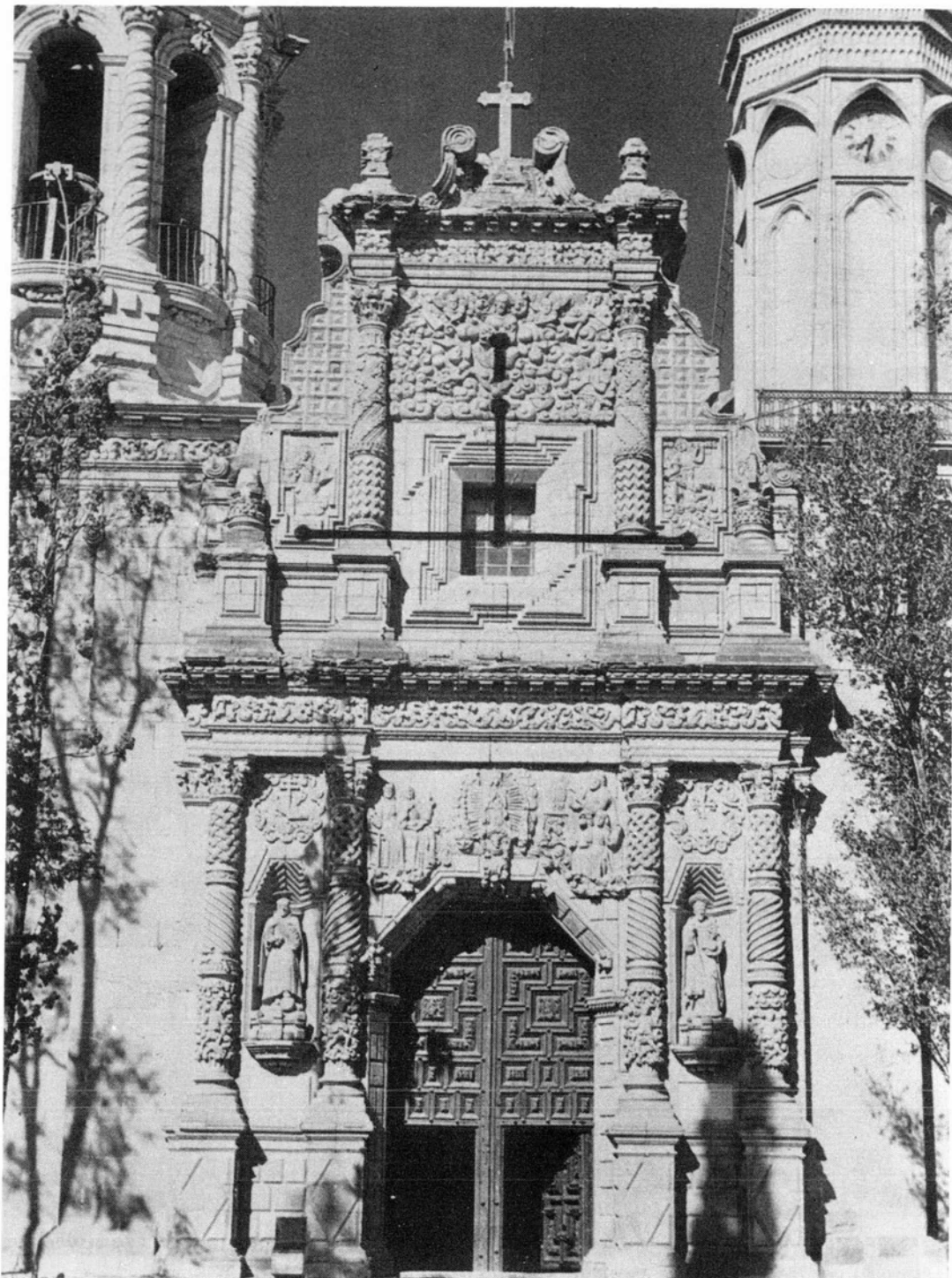
3. Fachada de la iglesia del convento de Guadalupe, Zacatecas. En ella se apunta la relación de la Trinidad con la Anunciación por medio de la ventana del coro.