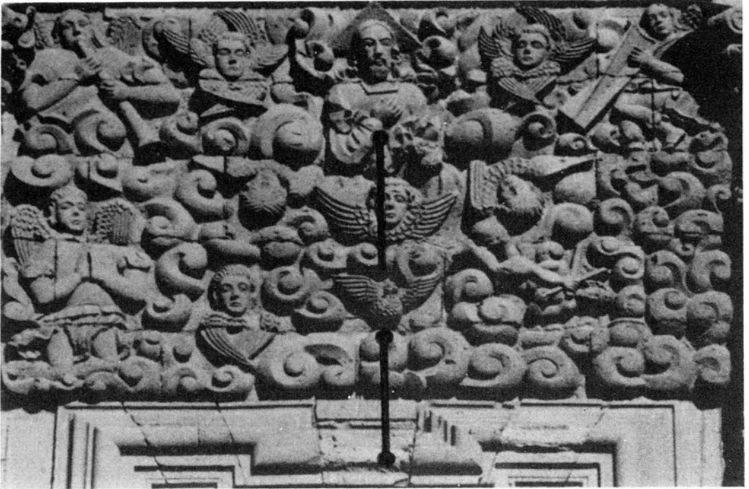
2. Relieve en la parte superior de la portada de Guadalupe, Zacatecas. En él, sólo aparecen el Padre y el Espíritu Santo, pero en su unión apuntan hacia la ventana del coro.