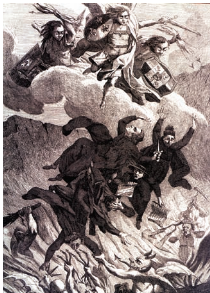
10. Anónimo, La condenación de los jesuitas , 1762, grabado sobre lámina. Biblioteca Nacional de Francia. Tomado de “Los jesuitas ante el despotismo ilustrado”, Artes de México , núm. 92, diciembre 2008, p. 3.

reciben con porras, tenazas y piquetas; mientras un sacerdote ignaciano aún empuña una daga, aludiendo al regicidio, vemos a otro, ya condenado, que ciñe una corona de tortura como símbolo de un poder del que fatalmente no puede desprenderse.