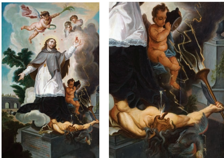
6a) Anónimo novohispano, San Juan Nepomuceno , siglo XVIII, óleo sobre tela, 209,3 × 126,6 × 2,8 cm (sin marco). Colección Museo de la Basílica de Guadalupe; b) detalle.

alcanzar hasta los sitiales de los canónigos potencialmente inquietos o belicosos (sobre todo los que vociferaban en contra de la tradición aparicionista de la imagen desde las sombras). Lo mismo que al loro, el áspid o la furia, los poderes de Juan tenían un efecto fulminante según la moraleja bien aprendida por los espectadores: “Le está bien el silencio, nada falla” (fig. 6b).