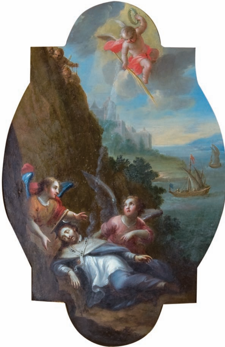
14. José de Ibarra (atribución), El cuerpo de san Josafat de Polotsky en la ribera del río Duna , ca. 1740, óleo sobre lámina de cobre, 40,5 × 28 cm. Fotografía: Eumelia Hernández, 2011. Colección Instituto de Investigaciones Estéticas, UNAM.