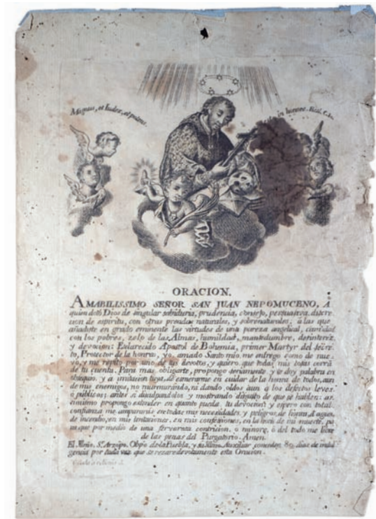
9. Anónimo novohispano, Oración de san Juan Nepomuceno , 1765, grabado sobre lámina. Colección Museo Soumaya. Fundación Carlos Slim, A.C. /Ciudad de México.

to avenida a dos partes, o entre el devoto y el santo, donde se afianzaba bajo juramento de palabra la guarda del silencio, a manera del voto por promesa: