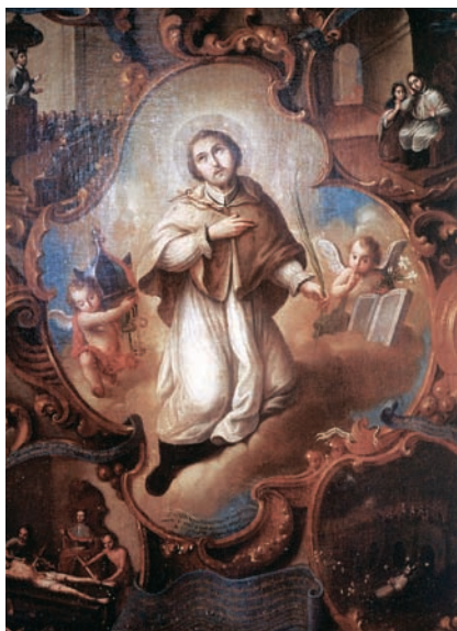
4. Marcos Fernández, San Juan Nepomuceno , 1775, óleo sobre tela, s. m., iglesia de San Juan Nepomuceno, Saltillo, Coahuila.

Luego de la abundante iconografía guadalupana y josefina del siglo XVIII, no hay otra más rica y diversa en el contexto novohispano que la del santo mártir, canónigo de Praga, ahogado por una turba de esbirros en el río Moldavia el 16 de mayo de 1383 (para otros, esto sucedió en realidad el 20 de marzo de 1393) (fig. 4). Todo por haberse resistido al despotismo y los caprichos del emperador Wenceslao de Bohemia, enfurecido por los celos y cuya esposa Juana, mujer piadosa, tenía en san Juan a su confesor de cabecera. En verdad se trata de un santo tardomedieval con perfiles más legendarios que reales y que, cumpliendo con su ministerio sacerdotal, se dice, padeció con estoicismo la tortura del tirano (precisamente por no revelar el secreto de confesión de su consorte). En realidad, se piensa que todo sucedió en medio de un conflicto de potestades entre la autoridad temporal y el arzobispado, alentado por el antipapa Clemente VII de Aviñón, quien buscaba aliados para legitimarse a cambio de favores y absoluciones otorgadas a pedido. Al cabo, pagando con