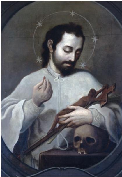
16. Francisco Antonio Vallejo (atribución), San Juan Nepomuceno , segunda mitad del siglo XVIII, óleo sobre tela. Colección Museo Soumaya. Fundación Carlos Slim, A.C. / Ciudad de México.