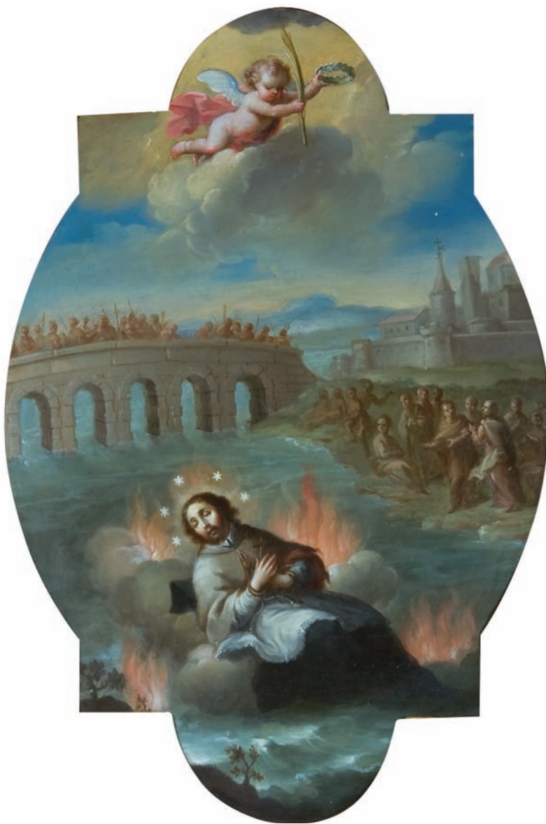
13. José de Ibarra (atribución), El cuerpo de san Juan Nepomuceno flota sobre el río Moldavia , ca. 1740, óleo sobre lámina de cobre, 41.1 × 28 cm. Foto: Eumelia Hernández, 2011. Colección Instituto de Investigaciones Estéticas, UNAM.