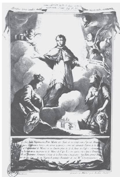
15 a) Anónimo novohispano, Alegoría de la jura de san Juan Nepomuceno como patrono de la Universidad de México, y la personificación de los reinos de España y Nueva España, 1745, óleo sobre tela, 269 × 191 cm, Museo Nacional de Historia. b) Mariano Salvador Maella (dibujó) y Joaquín Ballester (grabó), Alegoría de la jura de san Juan Nepomuceno como patrono de la Universidad de México, y la personificación de los reinos de España y Nueva España. Biblioteca de Estampas, Gabinete de Estampas, Madrid. Tomadas de La pintura emblemática en la Nueva España, México, Museo Nacional de Arte, 2004, pp. 105 y 385.