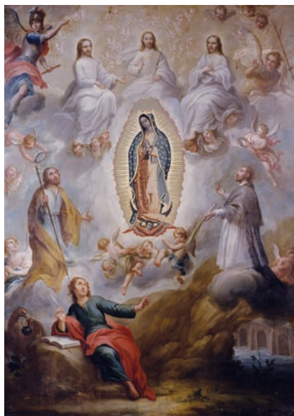
12. Francisco Antonio Vallejo, Visión de san Juan en Patmos-Tenochtitlan, con san José y san Juan Nepomuceno , 1771, óleo sobre lámina de cobre, 84,5 × 44,7 cm. Colección Museo Soumaya. Fundación Carlos Slim, A.C. / Ciudad de México.

que honra al juramento de los tres patronos titulares y principales de la Nueva España: san José (patriarca de la Iglesia indiana y la conversión de los indios), la Virgen de Guadalupe (del reino, sus ciudades y villas) y san Juan Nepomuceno (de sus cabildos y más importantes corporaciones). Muestra, además, un escenario marítimo y celestial enmarcado en medio de la revelación que tuvo san Juan Evangelista en Patmos, según el capítulo 12 del Apocalipsis: contemplando la figura de la Mujer Águila encinta y huyendo hacia el desierto para escapar del acoso de la bestia infernal. Como se sabe, este pasaje lo interpretó desde mediados del siglo xvii el teólogo criollo Miguel Sánchez, como una prefigura de las apariciones guadalupanas del Tepeyac en el valle de México. Por eso, aquí se mira “intervenido” el atributo principal de san Juan como escritor visionario, con pluma en mano: hay que notar que el águila no sólo es el tradicional símbolo que le corresponde en el tetramorfos (que además sostiene en el pico el tintero para que el evangelista moje la pluma), sino que se confunde deliberadamente con el ave fundacional de Tenochtitlán y, por eso mismo, se ha colocado a la vera de su tunal originario. 38 Este imaginario criollo esta-