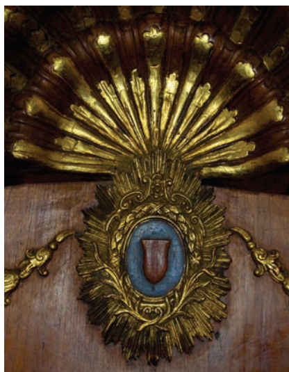
1a) Anónimo, Confesionario , segunda mitad del siglo XVIII, talla de madera policromada. parroquia del Pocito, Villa de Guadalupe. Foto: Eumelia Hernández. Conaculta-INAH-MÉX. “Reproducción autorizada por el Instituto Nacional de Antropología e Historia”; b) detalle.

la buena fama que debía acompañar a todo confesor eran aspectos fundamentales y delicados en el trato: era el referente más apreciado entre los suyos o bien podía entrar en conflictos indeseables, más aún si se relacionaba con personas de renombre, ya que estaba, a la vista de todos, el buen o mal desarrollo de esta práctica sacramental. En primer lugar, para evitar las murmuraciones o miradas escabrosas, el ministro tenía que predicar con el ejemplo y cuidarse del dicho: “no dar de qué hablar”. La solicitud de favores a través del auricular del confesionario, ya fuera de índole sexual o de poder, era la práctica más condenada precisamente porque transgredía el secreto y la santidad de un sacramento fundamental para dirigir las conciencias (aunque hoy todo pareciera un contrasentido) (fig. 1).