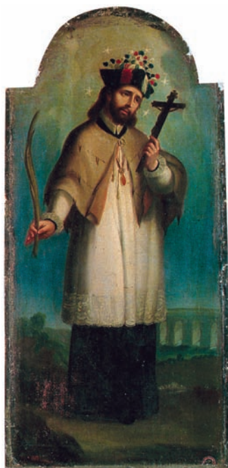
5. Anónimo, San Juan Nepomuceno (como doctor), segunda mitad del siglo XVII, óleo sobre tela, s. m., Museo Regional de Guadalajara. Foto: Pedro Cuevas, 1979. Archivo Fotográfico Manuel Toussaint, IIE-UNAM. Conaculta-INAH-MÉX. “Reproducción autorizada por el Instituto Nacional de Antropología e Historia”.

con legítima aspiración, y más allá del cargo y el grado (de hecho, el panegírico literario corría a cargo de los jóvenes como deferencia de los mayores a los talentos de los menores); de allí que en ocasiones, en sus imágenes, san Juan luzca el birrete doctoral con las cuatro borlas (las sendas facultades) que alude a los grados que obtuvo en Padua, pero con la forma y las características de los birretes de los doctores novohispanos (fig. 5).