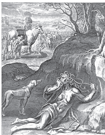
7. Otto van Veen, Theatro moral de la vida humana en cien emblemas , op. cit. (vid supra n. 25), emblema 30: la Envidia.

Aquí hay que entender que las campanas adquieren un significado semejante al de las lenguas o que se desempeñan como vehículos comunicativos que publican, a voces, todo aquello que debe mantenerse en el ámbito privado. Tampoco olvidemos que entre las varias vidas de san Juan Nepomuceno escritas en la Nueva España, una de ellas lo motejaba en el título como El milagroso bohemio y harpócrato cristiano ; y es claro que el culto al silencioso dios Harpócrates era bien conocido entre la clase acomodada de la sociedad criolla, merced a los biombos que reproducían los modelos emblemáticos de Otto van Veen y su virtuosa ponderación del silencio (mediante el gesto del tacere o con dedo índice oprimiendo los labios), conforme a su emblema 29 que lleva por mote “Nada más provechoso que el silencio” (fig. 8). 27