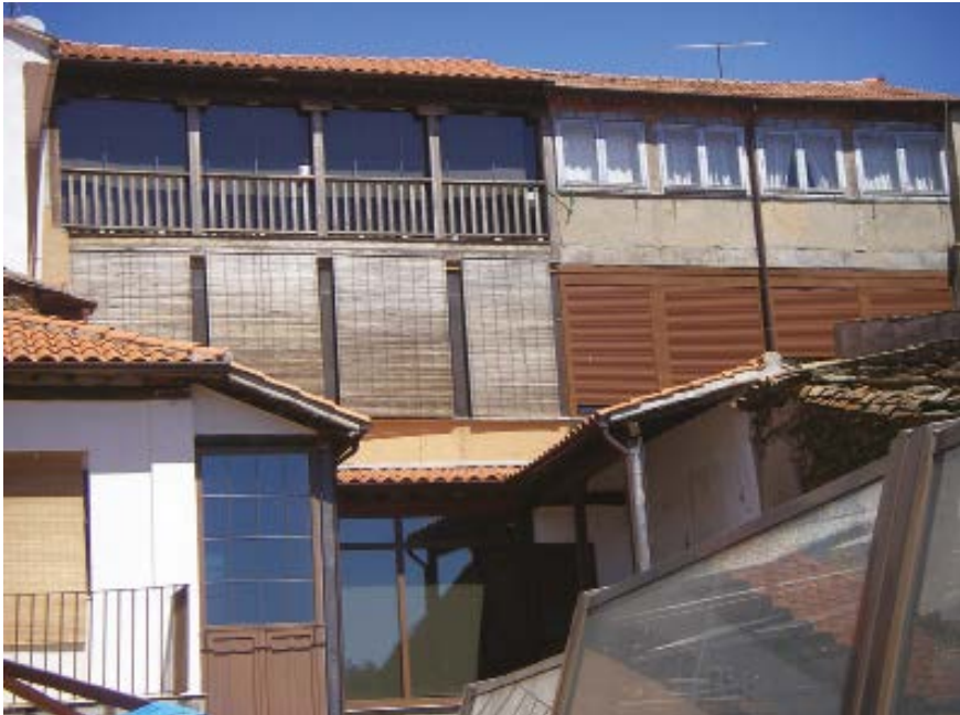
9. Galerías traseras de la Casa Corcobado en Alcañices.

especialmente evidente en los edificios penitenciarios. La prisión, a juicio de Foucault, es la más poderosa herramienta de control y educación del individuo, ya que allí el Estado dispone de la libertad y del tiempo de la persona; de todas sus facultades físicas y morales. 36