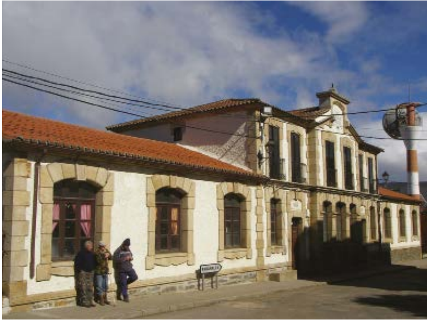
3. Vista actual del edificio escolar, con las alas reducidas para las clases y el primer piso para vivienda de los docentes.

ta. Así pues, se eliminaron las galerías cubiertas laterales y la galería acristalada trasera. El inmueble quedó reducido a un cuerpo central, al que se adosaban por cada lado sendas aulas para niños y niñas. Los baños ya no eran una prolongación del cuerpo central, sino que formaban parte de él, y compartían espacio con el acceso a las viviendas de los maestros y dependencias auxiliares de las aulas. Además, se construyó un primer piso sobre el cuerpo central para vivienda de los maestros (fig. 3), un esquema que había sido muy habitual en las construcciones escolares hasta la promulgación de la legislación de Cortezo (véase n. 17). 22