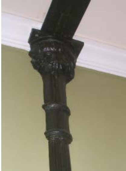
6. Columna de fundición en el interior de la vivienda.

La zona residencial se articula en torno a un núcleo central formado por un patio de luces y una escalera, también utilizados por el tracista en Zamora, y es habitual en las viviendas del ensanche barcelonés que proyectó. 34 Al menos una de las dos viviendas en las que está dividido el inmueble actualmente conserva en buena parte la distribución original, que describiré a continuación.