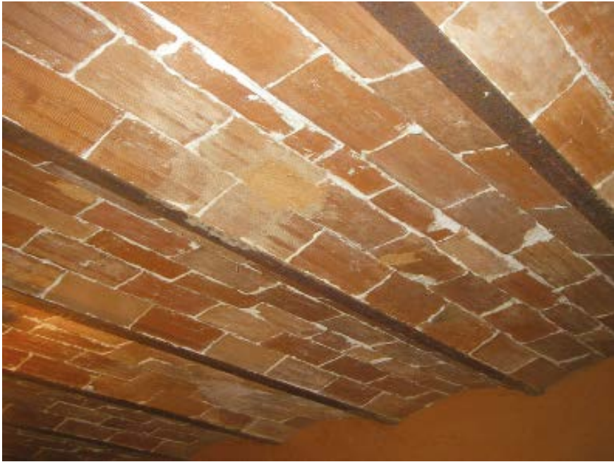
7. Viguería con perfil de doble T que sustenta las bovedillas de rasilla.

el dormitorio principal. Por su parte, el edificio auxiliar para alojamiento del servicio doméstico y almacenamiento de productos agrarios comunica con la vivienda burguesa a través de la mentada cocina.