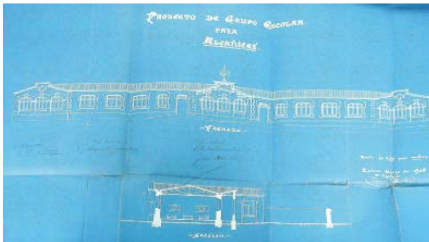
2. Francisco Ferriol, "Proyecto de grupo escolar para Alcañices (fachada y sección)", marzo de 1908. AMA, caja 135, carpeta 4.

un aula única (por sexo) para concentrar todas las edades, no aulas diferentes por cursos. 19