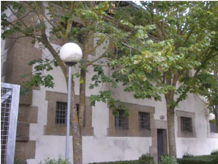
II. Antigua juzgado y cárcel de partido en Bermillo de Sayago.