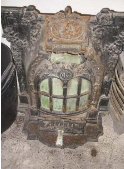
10. Frente de chimenea de la vivienda, actualmente retirado.

que el edificio que voy a referir coincide en el tiempo con el impulso que supuso la promulgación del real decreto del 5 de mayo de 1913, que implantaba definitivamente el sistema penitenciario progresivo. 38 El real decreto estipulaba que los establecimientos penitenciarios enclavados en las cabeceras de partido judicial, como la de Alcañices, estaban destinados a prisión preventiva durante la substanciación del sumario, el cumplimiento de penas de arresto mayor de civiles, así como para la estancia accidental de reclusos transeúntes que iban a cumplir condena en otras prisiones, o la práctica de diligencias