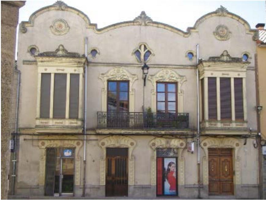
5. Aspecto actual de la casa Corcobado en Alcañices, fachada principal.

1911, pues en abril de 1911 el promotor fue autorizado por parte del ayuntamiento para el acopio en la plaza mayor de materiales con destino a la construcción de su casa. 27