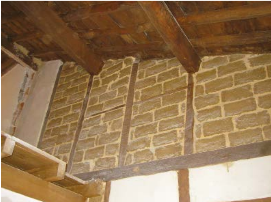
8. Tabiques interiores con entramado de madera y adobe en el edificio auxiliar.

Para calentar la casa se disponía de varias chimeneas prefabricadas, de hierro fundido (fig. 10), con portezuela y depósito para recoger cómodamente las cenizas. No paraban ahí las comodidades de la casa, pues por lo menos un banco de hierro fundido y madera fue instalado en el huerto-jardín, cuyos soportes aún se conservan, señal inequívoca de que este espacio servía para solaz de los residentes, así como para el cultivo de frutas y verduras.