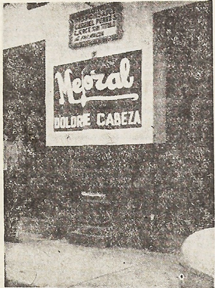
La picota y el Mejoral.