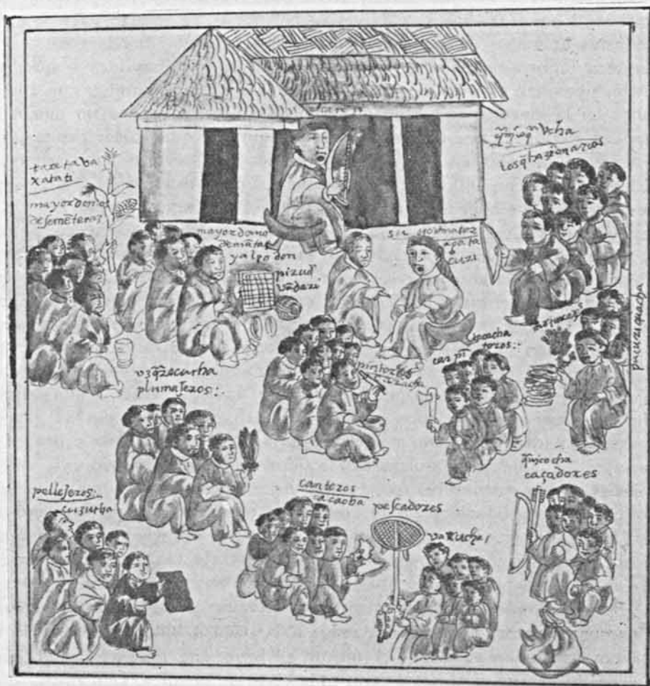
RELACION DE MICHOACAN Trabajadores y artistas