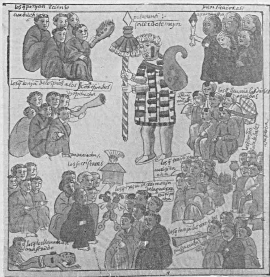
RELACION DE MICHOACAN Los sacerdotes y empleados de los templos

Estos son los sacerdotes y oficiales de los cultos